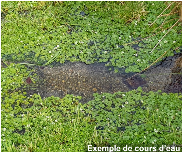
Exemple de cours d'eau

L'écoulement peut ne pas être permanent compte tenu des conditions hydrologiques et géologiques locales.