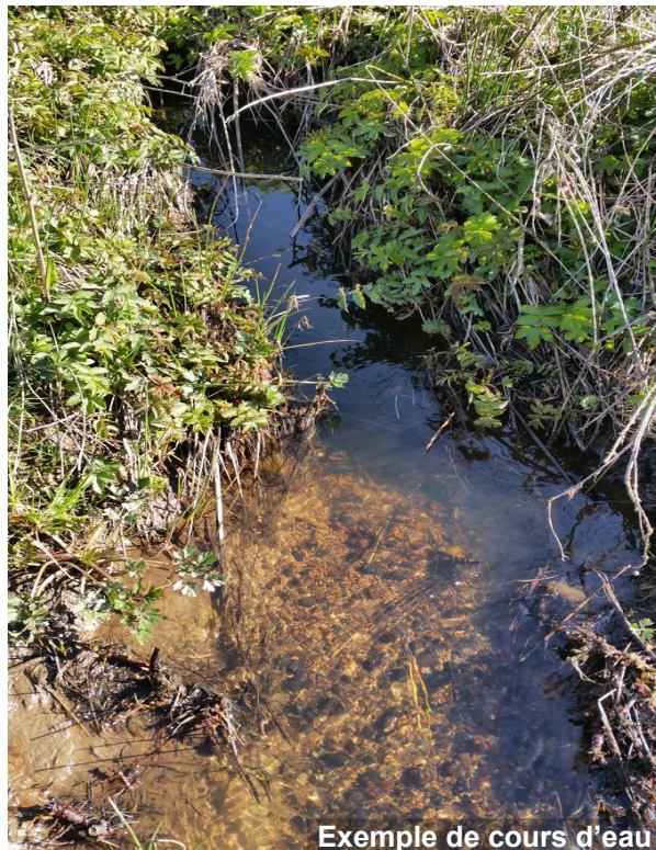
Exemple de cours d'eau

Les opérations 1, 2 et 3 du schéma ci-contre ne nécessitent aucune formalité administrative préalable.