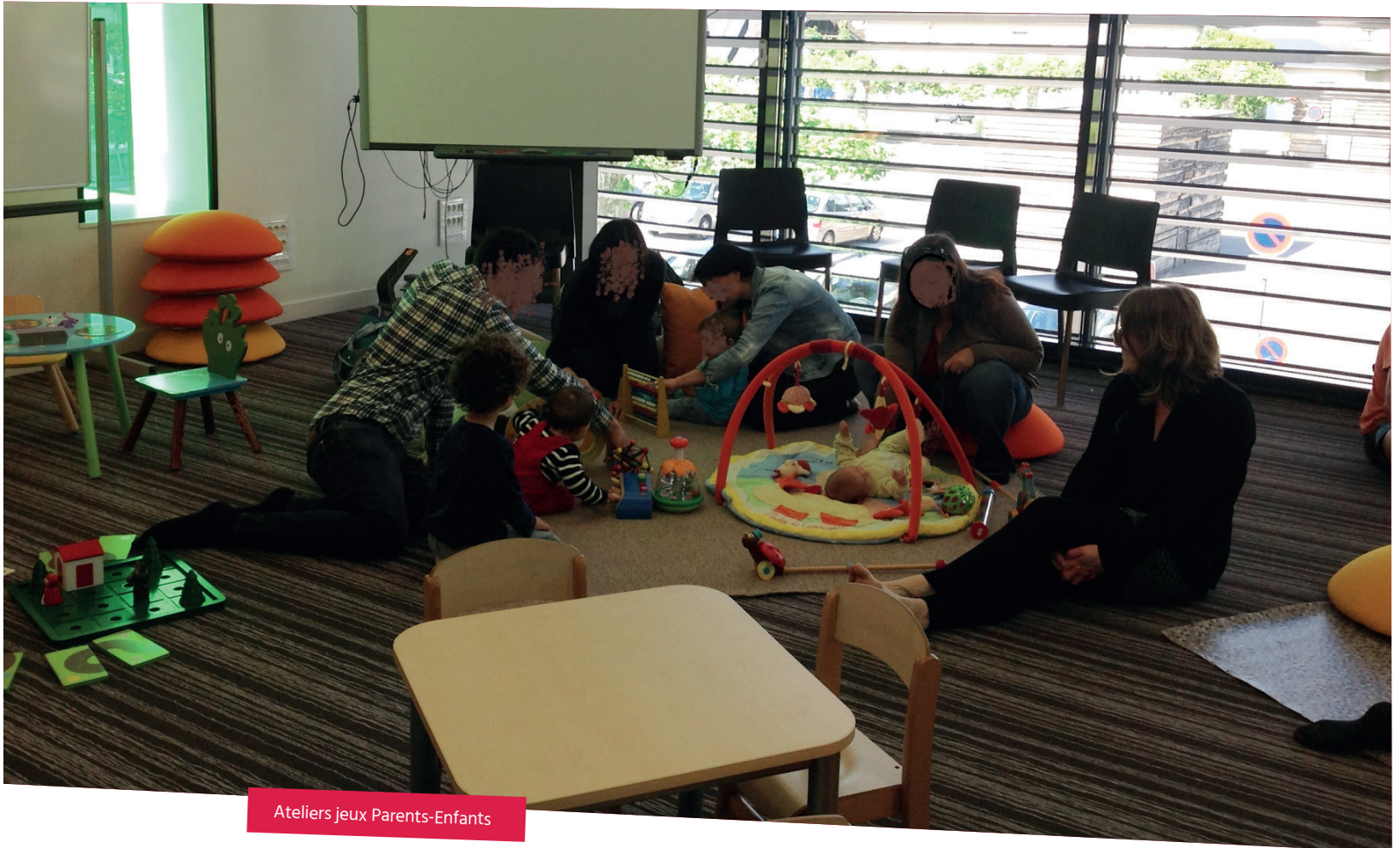
Ateliers jeux Parents-Enfants