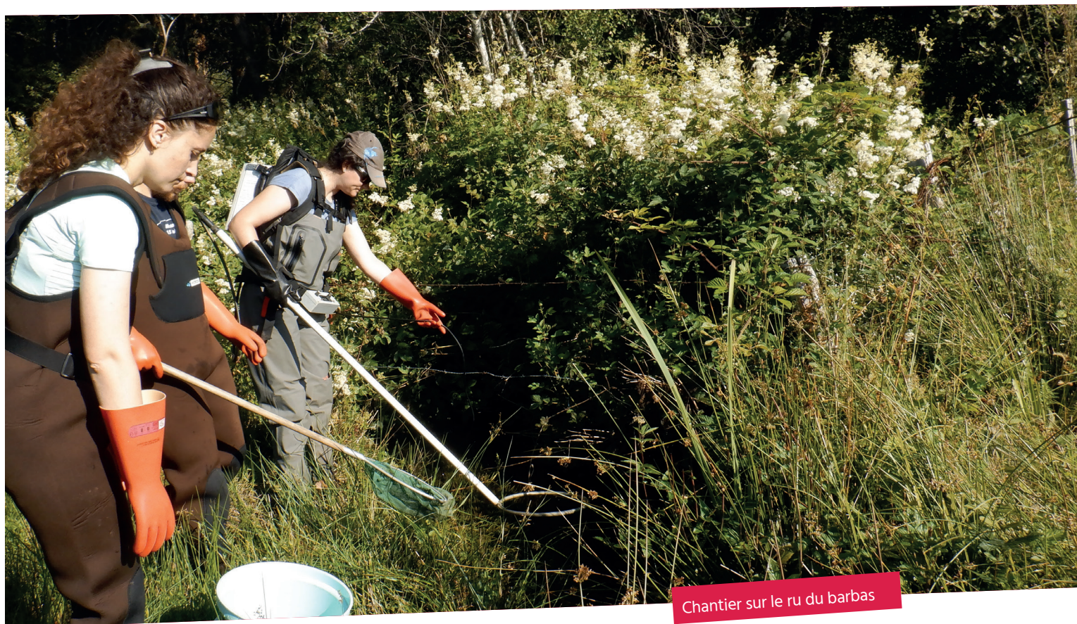
Chantier sur le ru du barbas