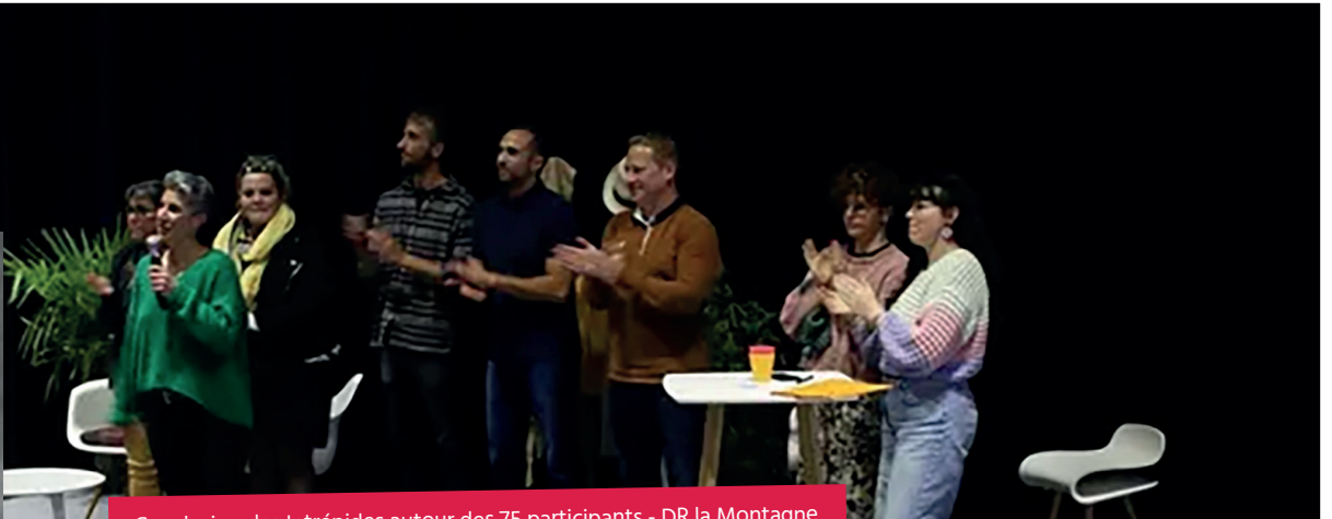
Conclusion des Intrépides autour des 75 participants - DR la Montagne